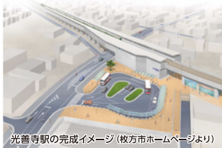
光善寺駅の完成イメージ

また、多世代が共存できる次世代型のまちづくりを進め、人口減少・少子高齢化社会におけるモデル都市となるような整備を促進します。