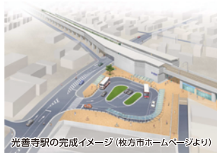
光善寺駅の完成イメージ

また、多世代が共存できる次世代型のまちづくりを進め、人口減少・少子高齢化社会におけるモデル都市となるような整備を促進します。